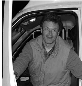
A megérkezés boldog pillanata – 1400 km után, éjjel fél egykor.

üzenete úgy a bizonyítottan Európa legelvilágiasodottabb luxemburgi térségében, mint a saját közelmúltjával szembenálló középeurópai profanításában egy és ugyanaz: a Krisztus szeretetért megélhetjük Istentől kapott elhívásunkat. Ez azt is jelenti, hogy kicseréljük élményeinket, tapasztalásainkat; tudósítjuk egymást sikereinkről, kevésbé sikerült dolgainkról és nehézségeinkről. Ez jelenti tehát számunkra a „profitot“, azaz az egymás – a tatai és az esch-alzettei gyülekezet – tagjainak élő kapcsolatban való meggazdagítását.