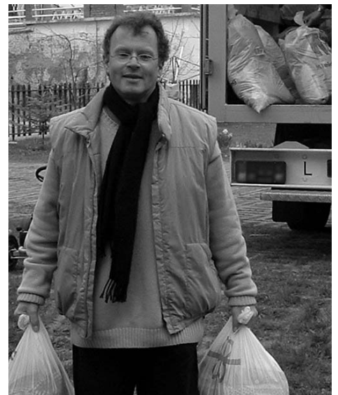
A kirakodás... csütörtök este. 266 zsák és karton – mindösszesen 1588 kg.

amikor csoportosan is eljuthattunk ide és mindannyian élvezhettük a tatai gyülekezet testvéri szeretetét. Ennek a találkozásnak a mai napon is érezhető hatása van, hiszen mindazok nevében, akik akkor itt voltak köszöntésemet kell hogy átadjam mindenk előtt a tatai gyülekezet azon tagjainak, akik vendéglátóik voltak. Ez is jelzi, hogy kapcsolatunk nem csak hivatali szintű, hanem tagok közötti élő kapcsolat. Mi sem bizonyítja ezt jobban, mint azok a levelek, melyek Tatáról érkeznek, s egy-egy esch-alzettei istentisztelet utáni beszélgetésben említést nyernek; előhözva és újra átélve ezzel a szép közös tatai