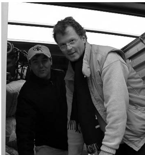
A kipakolás rövid szünetében.

üzenete úgy a bizonyítottan Európa legelvilágiasodottabb luxemburgi térségében, mint a saját közelmúltjával szembenálló középeurópai profanításában egy és ugyanaz: a Krisztus szeretetért megélhetjük Istentől kapott elhívásunkat. Ez azt is jelenti, hogy kicseréljük élményeinket, tapasztalásainkat; tudósítjuk egymást sikereinkről, kevésbé sikerült dolgainkról és nehézségeinkről. Ez jelenti tehát számunkra a „profitot“, azaz az egymás – a tatai és az esch-alzettei gyülekezet – tagjainak élő kapcsolatban való meggazdagítását.