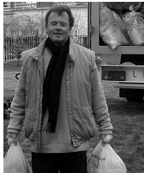
A kirakodás... csütörtök este. 266 zsák és karton – mindösszesen 1588 kg.

Ahogy az elmúlt években sikerült újra és újra elutaznunk ide Tatára, s a két évvel ezelőtti eseményt hadd említsem meg most, hiszen ez csúcspontja volt testvérgyülekezeti kapcsolatunknak, amikor csoportosan is eljuthattunk ide és mindannyian élvezhettük a tatai gyülekezet testvéri szeretetét. Ennek a találkozásnak a mai napon is érezhető hatása van, hiszen mindazok nevében, akik akkor itt voltak köszöntésemet kell hogy átadjam mindenk előtt a tatai gyülekezet azon tagjainak, akik vendéglátóik voltak. Ez is jelzi, hogy kapcsolatunk nem csak hivatali szintű, hanem tagok közötti élő kapcsolat. Mi sem bizonyítja ezt jobban, mint azok a levelek, melyek Tatáról érkeznek, s egy-egy esch-alzettei istentisztelet utáni beszélgetésben említést nyernek; előhova és újra átélve ezzel a szép közös tatai