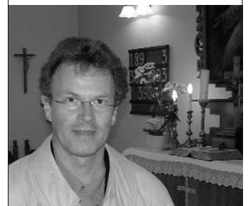
Luxemburgi lelkésztestvéremnek megmutattam a felújított világtársrendszert is, aki velünk együtt örült legújabb eredményeinknek.