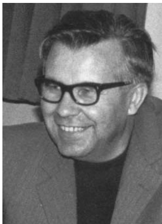
Egy külföldi konferencián – valamikor az 1970-es években.

Elsőéves teológusként naivitást sejtető Krisztus-hite tette rám a legnagyobb hatást. Évekkel később láttam, hogy ez az bizonyos karlsruheri második naivitás, ami az Isten legnagyobb ajándékainak egyi-