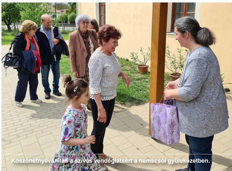
Köszönetnyilvánítás a szíves vendéglátsért a nemcsói gyülekezetben.