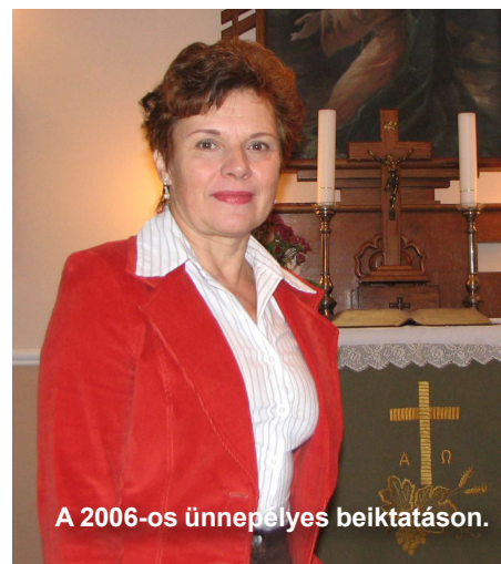
A 2006-os ünnepélyes beiktatáson.