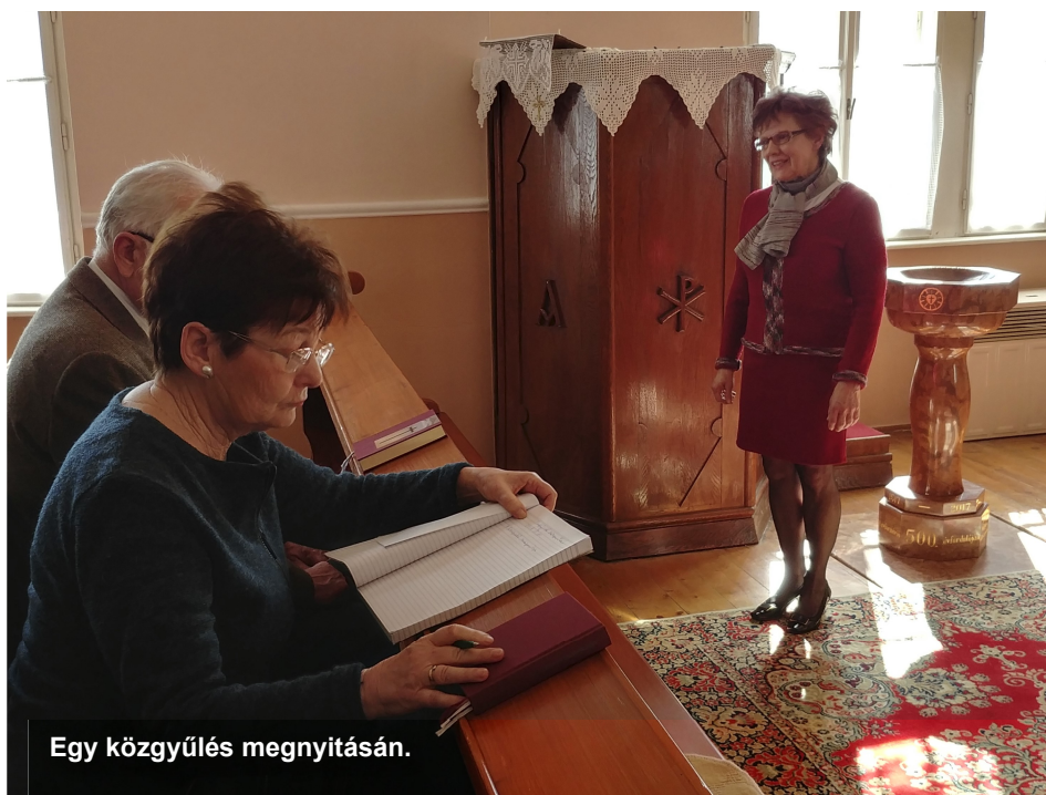
Egy közgyűlés megnyitásán.

De szívesen emlékszem vissza a Tatán megrendezett Szélrózsa Evangélikus Találkozóra vagy az évenként ismétlődő egyházmegyei közgyűlésekre, testvéri találkozókra, rendezvényekre. Fontos megemlítenem, hogy mindig nagy örömmel népszerűsítettem az immáron 33. évfolyamába lépett gyülekezeti újságunkat a Lutherórsát , melyek hűen tükrözték gyülekezetünk mozgalmas hitéletét. De lelkes urunk online-munkásságát is mindig örömmel és büszkeséggel népszerűsíttem, – csöndben itt-ott szerényen megjegyezve – hogy én lehettem ennek a gyülekezetnek a felügyelője az elmúlt ciklusokban.