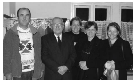
Az újrálátás öröme... lelkes és konfirmandusai. És megfakult fotó a kézben: a csöngei időszak...