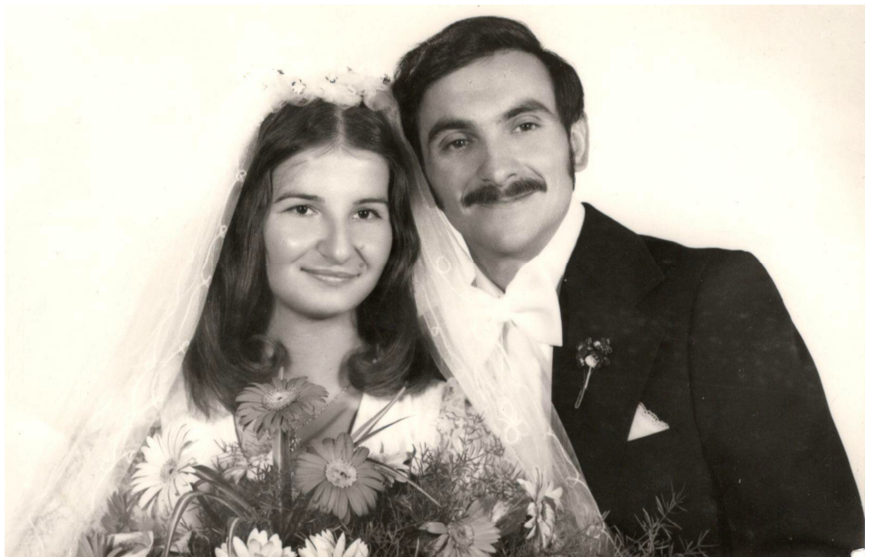
A ‘nagy nap’, 1976-ban, amikor örök hűséget fogadtunk egymásnak...