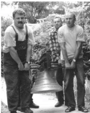
A „négyemberes“ harang a végleges házába, a toronyba készül.